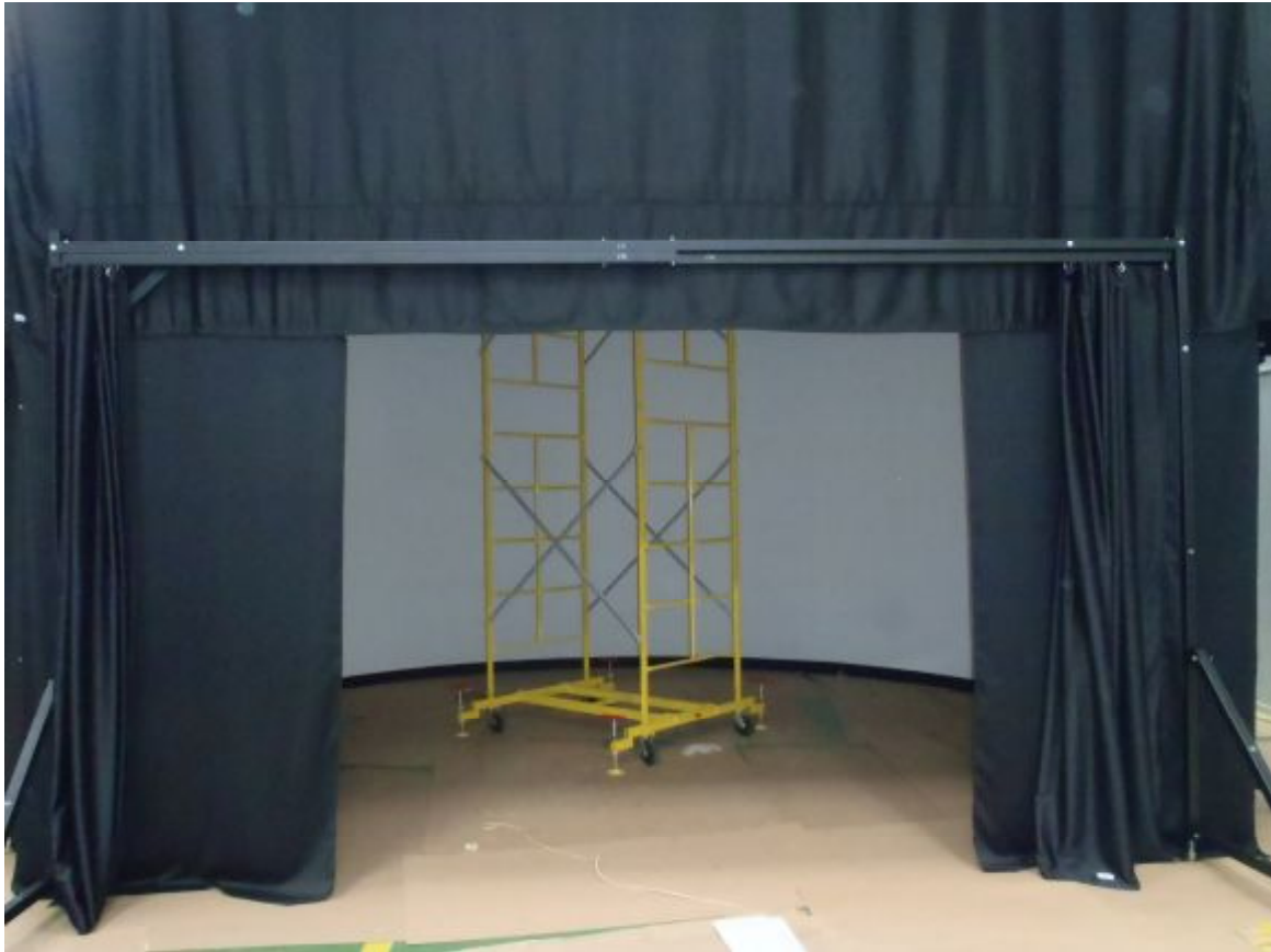
Вход в ЭЖ с раздвинутыми шторами и монтажной площадкой